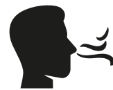
Reuk- en/of smaak- verlies

Heb je op dit moment een huisgenoot met milde klachten en koorts en/of benaauwdheid?